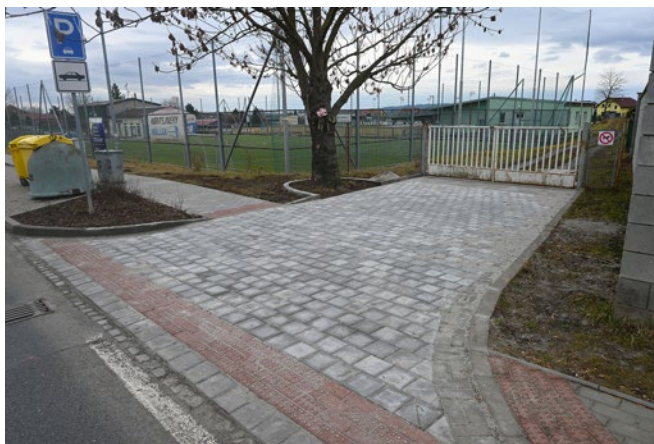
Oprava vjezdu do areálu hřiště