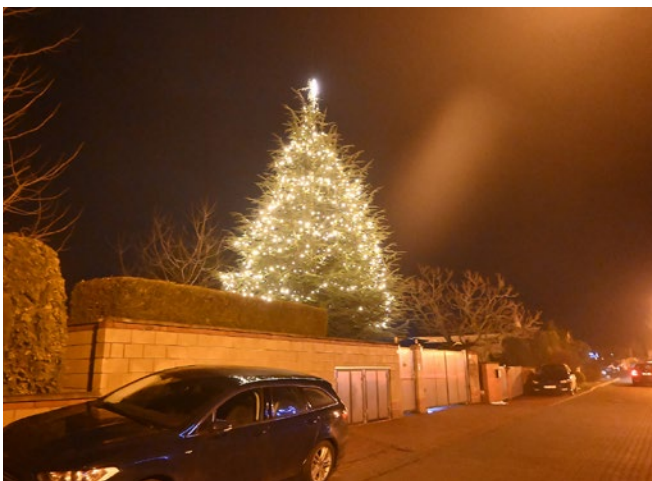
Vánoční výzdoba Na Zámkově