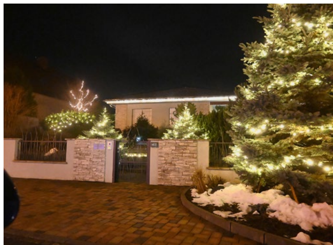
Vánoční výzdoba v ulici K Floriánku