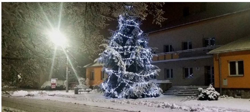
Vánoční výzdoba před obecním úřadem