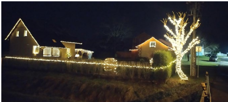
Vánoční výzdoba v ulici Západní