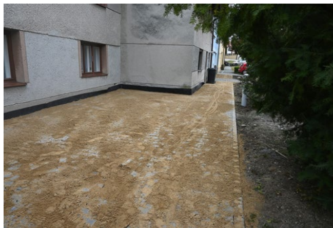
Výstavba chodníku Velký Klupoš

Stavební práce zimní měsíce nezastavily. Dokončili jsme předláždění vjezdu do sportovního areálu za hřištěm s umělou plochou. Po přeložkách ČEZ a zařízení CETINU byl dokončen chodník na Velkém Klupoři.