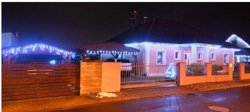
Vánoční výzdoba v ulici Za Školou