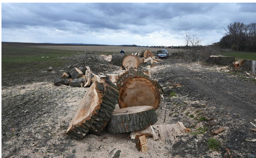
Staré a nemocné topoly podél cyklotrasy do Ústína nahradí alej nových stromů