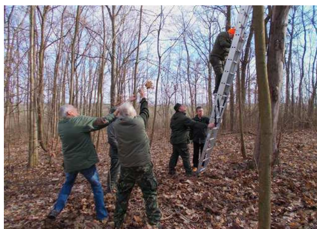
Sundávání ulomených větví