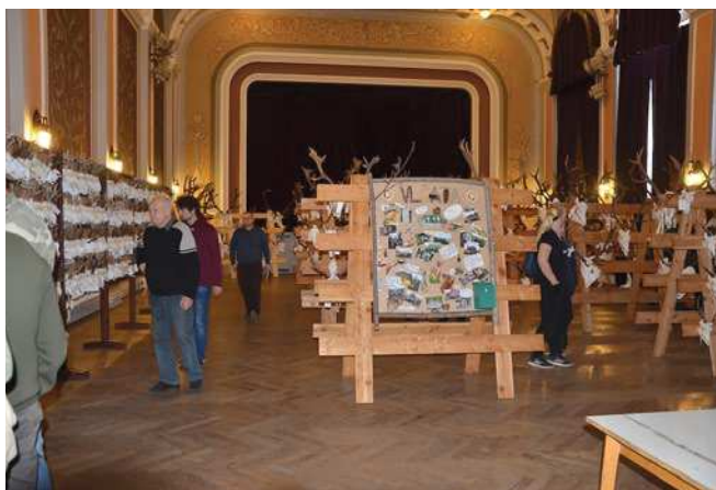
Pohled do sálu