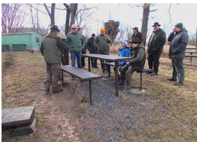
Skupina sčítačů zvěře