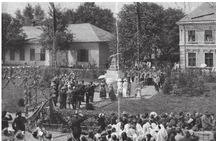
Slavnostní odhalení pomníku 2. června 1916

Pomník byl dokončen a obci slavnostně předán na začátku června 1916. Po