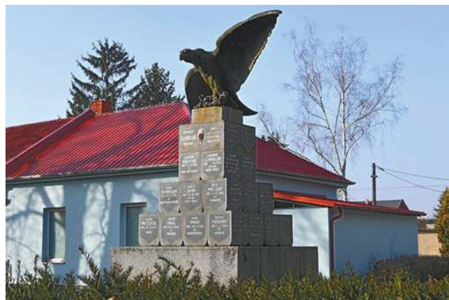
Současná podoba pomníku, snímek z roku 2021