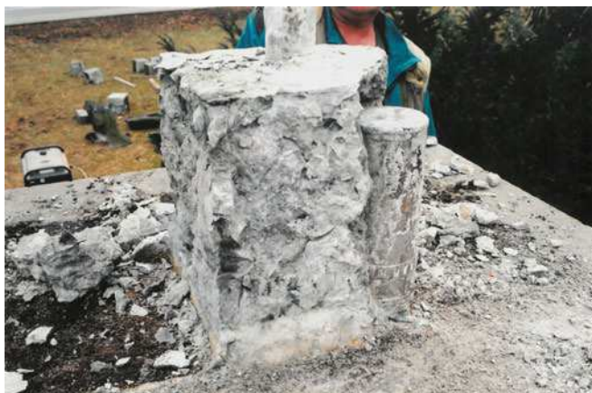
Nalezení kartuše v podstavci při rekonstrukci 2013