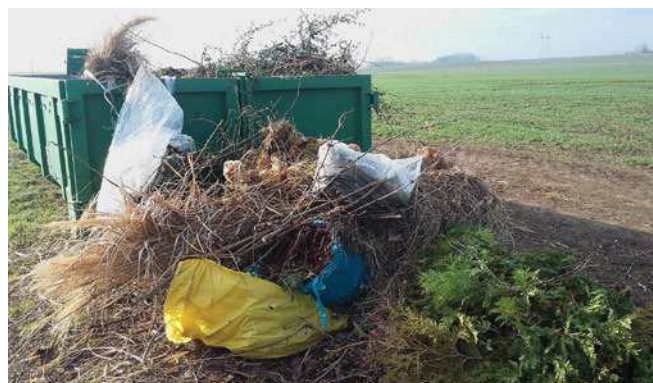
Někteří neukáznění občané znehodnocují bioodpad, házejí do něj nevhodný odpad. Svozová firma chce kvůli těmto problémům zvyšovat platby.

Bohužel, kvůli neukázněnosti některých občanů nechce svozová firma kontejnery vyvážet. Také kvůli těmto problémům nám firma chtěla zvýšit platbu z dosavadních 13 000 Kč za měsíc na enormních 36 000 Kč za měsíc. To by znamenalo zvýšení poplatku za odpad skoro o 200 korun na jednoho obyvatele. Chtěli bychom proto upozornit, že na obecním úřadě je možné zapůjčit dotovaný kompostér. S nastupující legislativou v ob-