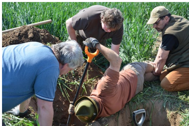
Kopání k uvolnění jezevčika

Společně s kamarády z Klubu chovatelů jezevčků ČR jsme norování uskutečnili v ranních hodinách 14. května. Všechny označené nory byly v obilném poli. První z nich byla již podle reakcí jezevčika neobsazena. A tak nezbývalo nic jiného, než dát nářadí na ramena, vrátit se k autům a přesunout se k další noře. Ta byla v poli nedaleko dálnice a liščí pach byl cítit už z dálky, na což velice aktivně reagovali jezevčici. Vyježděný vsuk nasvědčoval, že je nora často navštěvovaná, nebo v ní jsou liščata. Když vlezl do nory první jezevčik, uslyšeli jsme zanedlouho jeho štěkot, a tak nastalo měření, odkud vychází. Na řadu přišel rýč, krumpáč a lopata. První míra byla vedle, a tak honem znovu krumpáč s lopatou, plivanec do dlaní a pokračujeme. Tentokrát byl odhad lepší, dostali jsme se do blízkosti jezevčika, který po krátké době vynesl jedno lišče odkrytou částí nory. Další živá liščata byla odne-