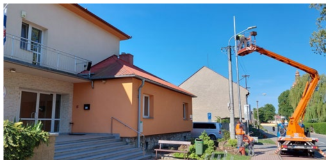
Obměna veřejného osvětlení u obecního úřadu

Hlavní úkol v oblasti výstavby vidíme v součinnosti s ČEZ při umístění rozvodů nízkého napětí do země.