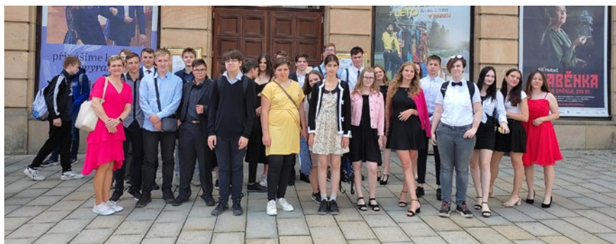
Osmáci a devětáci se vydali do Moravského divadla na představení Sluha dvou pánů

6. třída přežila chůzi do Skal, zažila oficiálně první společné šnečí závody, založila oheň i přes mokré dřevo, užila si hru na schovávanou i první třešně, šžila