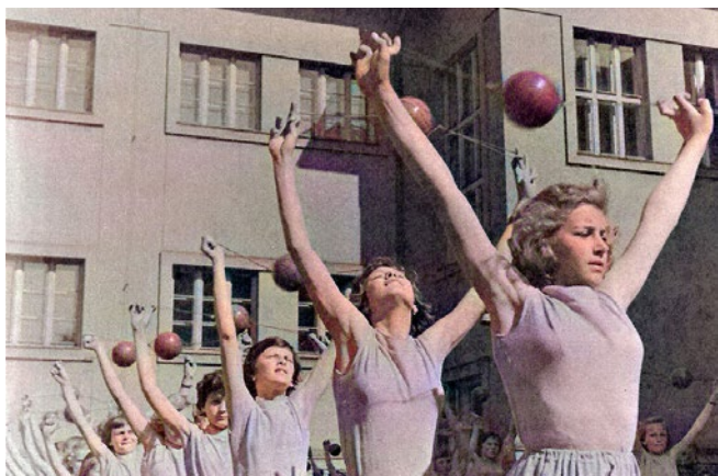
Červené míčky, 1960

O tom, jaké byly oslavy Mezinárodního dne dětí v Hněvotíně na přelomu 50. a 60. let, vypovídají v úvodu zmíněné kolorované fotografie. Centrem oslav byl školní dvůr, kde se sešli všichni žáci a učitelé