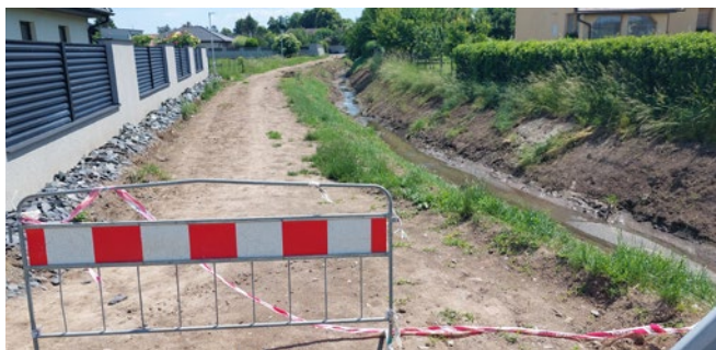
Stavba zpevněné komunikace U Potoka