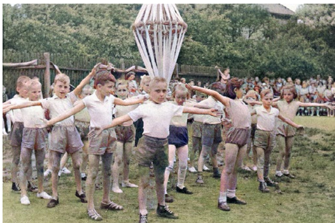
Detail vystupujících dětí, 1959

Unikátní snímky z archivu Základní školy Hněvotín nás vracejí zpět do let 1959 a 1960, kdy vznikly černobílé snímky z oslav Mezinárodního dne dětí, které bylo nyní možné díky současné technice kolorovat, aby co nejlépe dokreslily tehdejší atmosféru.