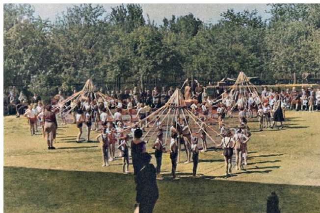
Nejmladší děti a Pohádka o Honzovi, 1960

Vážení čtenáři, obracíme se na Vás s prosbou: pokud máte nějaké vlastní zážitky, fotografie či zprostředkované informace o tom, jak v minulosti vypadaly oslavy Mezinárodního dne dětí v Hněvotíně, pošlete mi je prosím e-mailem: kronika.hnevotin@email.cz .