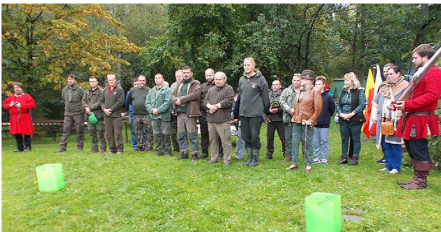
Nástup střelců před zahájením soutěže o Pohár svatého Václava