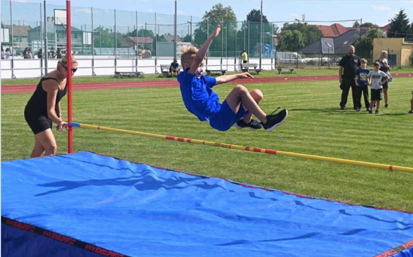
HNĚVOTÍNSKÁ OLYMPIÁDA. Více čtěte na straně 15