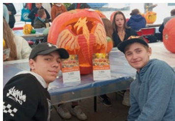
Vyřezaný drak letos zaujal nejen porotu