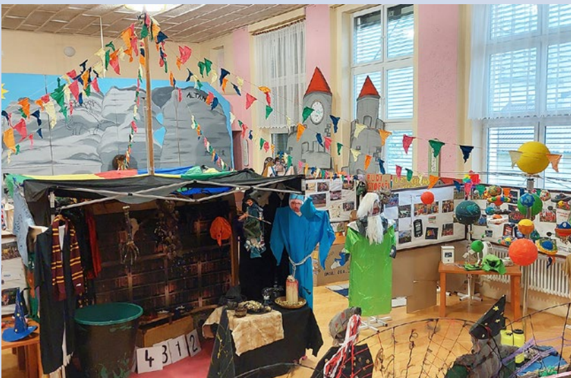
VÝSTAVA: LETNÍ DĚTSKÉ TÁBORY. Více čtěte na straně 13