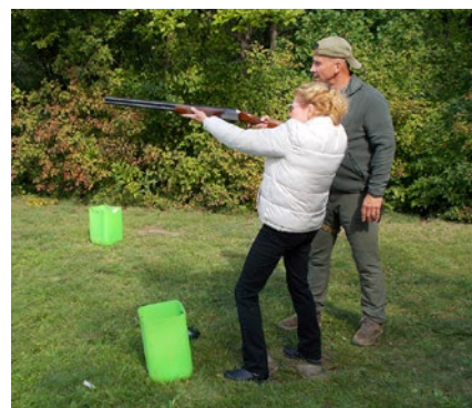
Střelbu si vyzkoušeli i někteří hosté

Zatímco jedna skupina střílela, ostatní včetně hostů navštívili kantýnu s přípravnými mísami s občerstvením a kafaře zas přilákala vůně právě pražené kávy. Nemalý