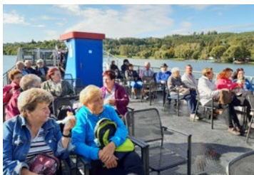
Výlet po Brněnské přehradě na Veverži se vydařil