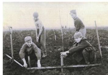
Školní pozemek v obrazech