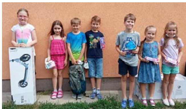
Živel – 1. a 2. třída

II. Kategorie (3., 4. a 5. třída): V této kategorii to porota neměla vůbec lehké. Jednalo se o kategorii nejpočetnější a zároveň velmi různorodou. Nakonec tedy porotci sáhli po nestandardním řešení a vyšla z toho dvě první místa.