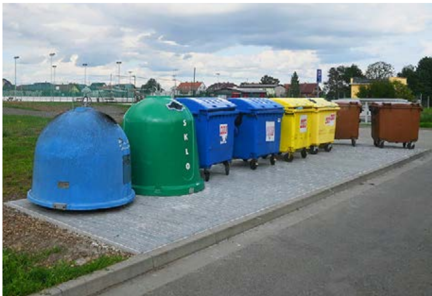
Jednou z investic poslední doby je i zkulturnění prostranství pro odpady za hřištěm

V posledních měsících se nám podařilo dokončit stavební úpravy hasičské zbrojnice, postavit atletický ovál, opravit zřícenou zeď hřbitova, přebudovat WC v základní škole na bezbariérové či vytvořit plochu pod kontejnery u hřiště. Dokončujeme chodník k Mrazírnám SAFI a pokračujeme na cyklotrase do Ústína a zpevnění komunikace k vrtu HVH-1.