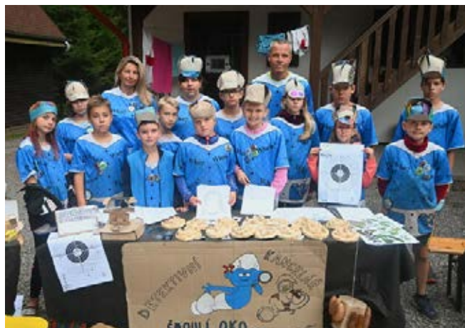
Šmoulí oko, s. r. o.

Pátrání nás zavedlo i dále od přehrady Pastviny, v úterý detektivové i s šéfinspektory vyrazili po stopách dělostřelecké pevnosti Hanička, která náleží do systému předválečného hraničního opevnění, který se budoval v letech 1936–1938, aby chránil naši vlast před nacistickým Německem. Technická kulturní památka Hanička umožňuje prohlídku plně vybaveného moderního úkrytu, podzemní část se nalézá v hloubce 18–36 m a dolů detektivové sestupovali po 96 schodech, podzemí propojují stovky metrů chodeb a sálů. Přestože jsme v chladu, tmě a vlhku strávili cca 2 hodiny, na povrchu detektivové využili místního občerstvení a ihned se posílili nákupem nanuků a studených kofol.