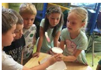
Děti si užily příměstské tábory KOUZELNÁ ŠKOLKA