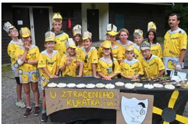
U Ztraceného kuřátka.com