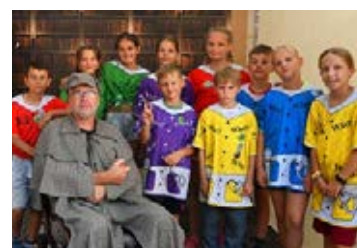
Tábor s detektivní zápletkou – PO STOPÁCH ...2021