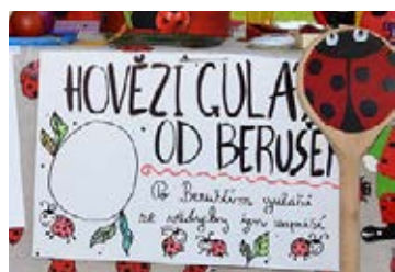
Hněvotínští kuchaři uvařili v Nemilanech nejlepší guláš