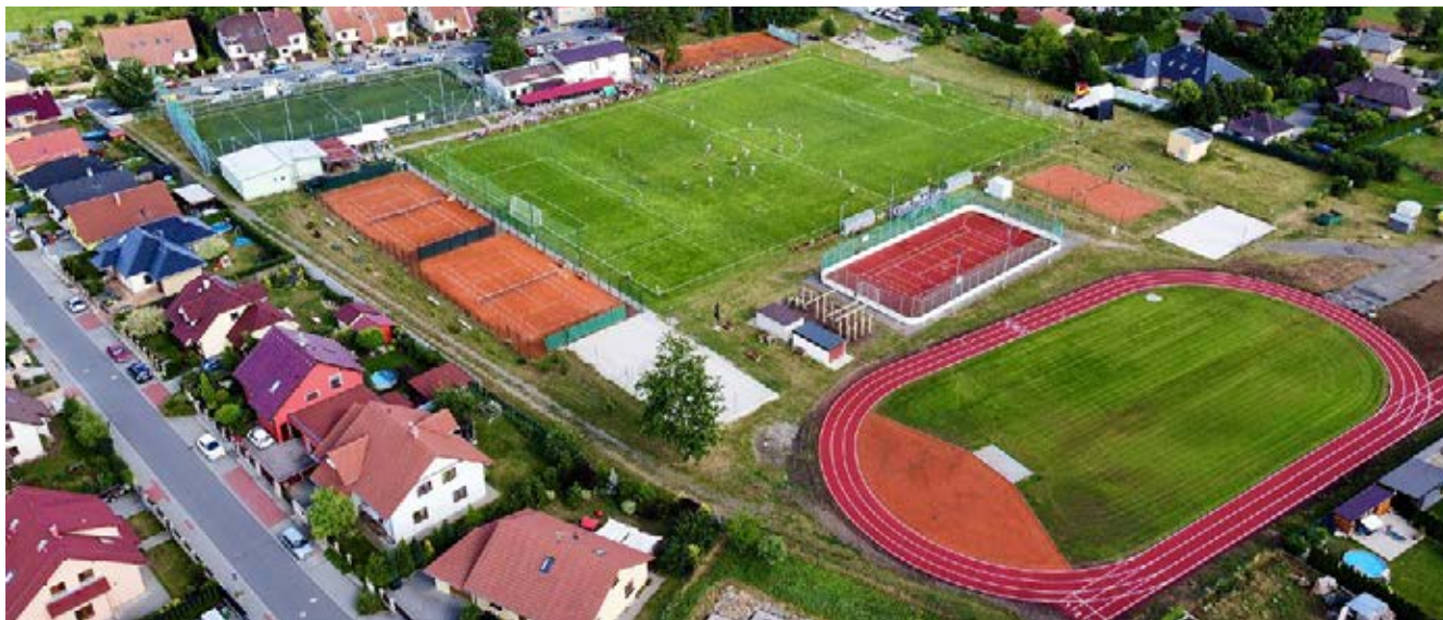
Nový ovál s tartanovou dráhou a plochou pro další lehkotletické disciplíny obohatil hněvotínský sportovní areál.