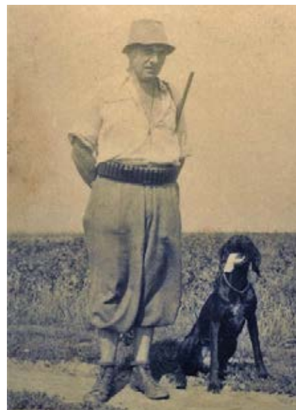
Na jedné z vycházek se psem