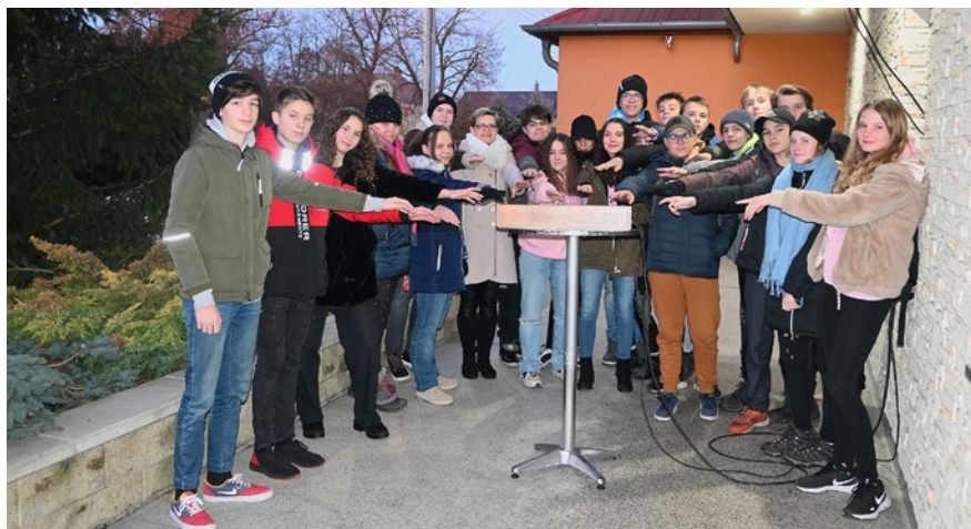
Deváťáci rozsvěcují vánoční strom před obecním úřadem