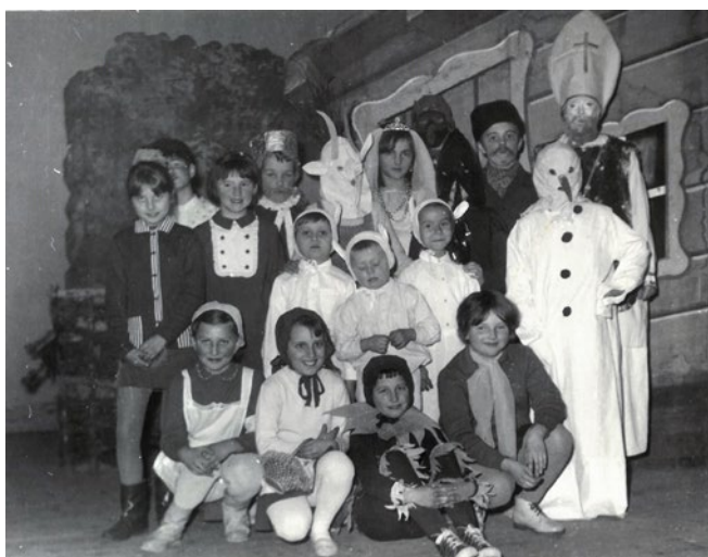
Vystupující děti na společné fotce s Mikulášem, kostýmy domácí výroby působí místy děsivě, 1969