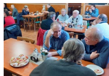
Valná hromada TJ FC Hněvotín zvolila nové vedení