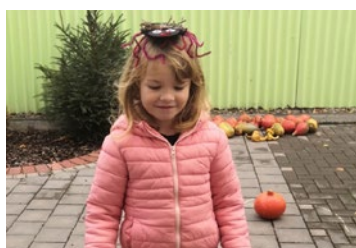
Halloween ve školce: Strašidel se nebojíme