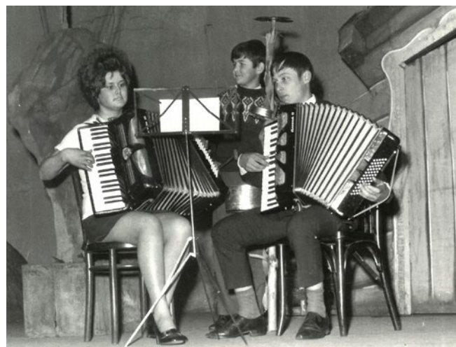
Součástí besídek byly i hudební vystoupení, 1970