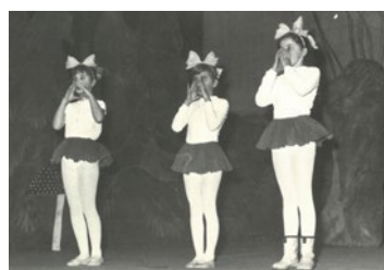
Začátky mikulášských besídek v Hněvotíně