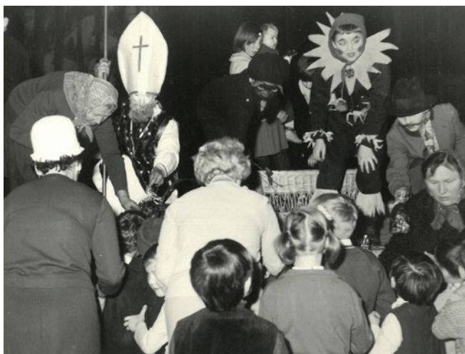
Úplně první mikulášská nadílka v režii Červeného kříže, 1968