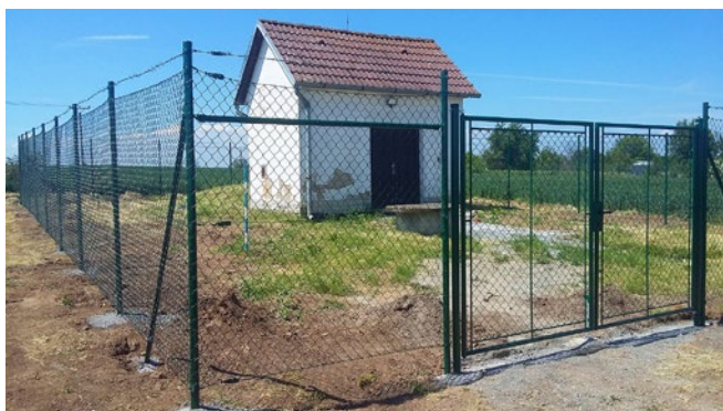
Oplocení vodárny na Malém Klupoři