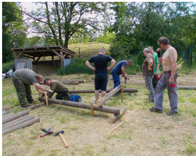
Výroba podstav pro kazatelny.

Jen co se rozvolnila kovidová opatření, svolal výbor Mysliveckého spolku Blata Hněvotín na sobotu 5. června první společnou brigádu s jasným zadáním. Udělat elektrickou přípojku a vyrobit a postavit áčkové podstavy pod budky kazatelen, které jsou již uskladněny a vzhledem k pandemii již delší dobu čekají na montáž a umístění v honitbě.