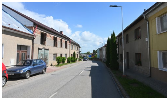
Nové veřejné osvětlení na Velkém Klupoři