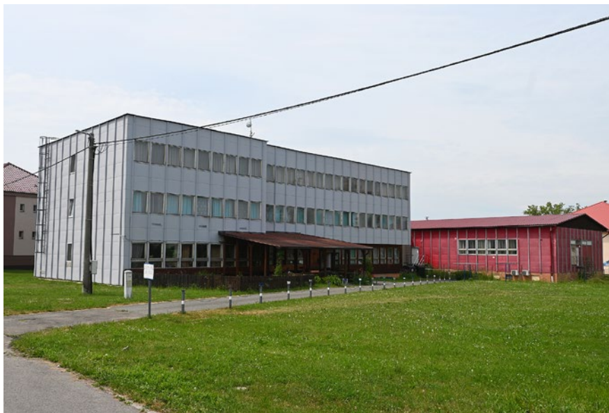
Nynější ubytovna, kde v 90. letech sídlila Soukromá střední škola stavební. Za budovou lze vidět i dřívější jídelnu zemědělského družstva, kde se studenti stravovali.

Jelikož šlo o školu soukromou, žáci si své studium financovali ze svého. Měsíční