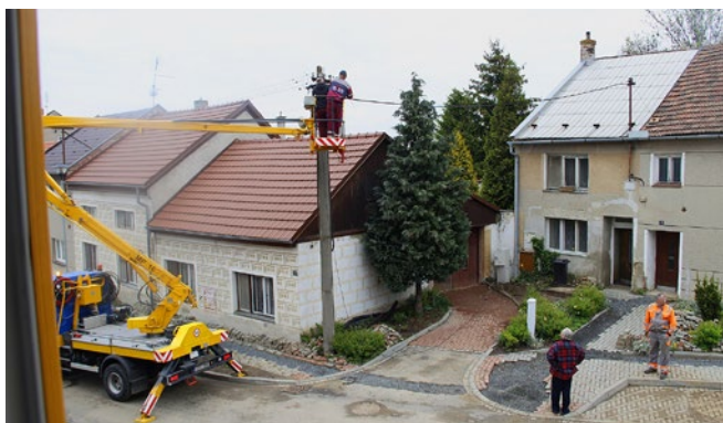
Likvidace sloupu s elektrickým vedením

V diskuzi zazněla řada názorů občanů na probíraná témata – odpady, parkování, průjezd kamionů, dopravní řešení apod. Připomínky a náměty budou po zpracování prezentovat zodpovědní funkcionáři na příštím zasedání. Bc. Aneta Glogarová