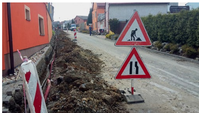
Přeložky vedení nízkého napětí elektrického proudu