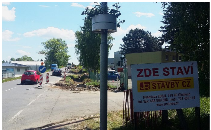
Přípravné práce ke stavbě chodníku k průmyslové zóně

Ekonomové tvrdí, že „peníze jsou až na prvním místě“. Možnost získání peněz z Evropské unie, ministerstev, různých fondů a Olomouckého kraje projednáváme prakticky na každém zasedání zastupitelů.