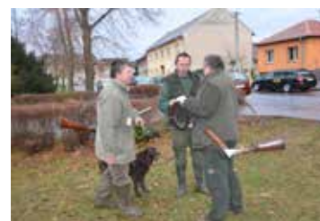
Bohatá spolková činnost hněvotínských myslivců strana 14