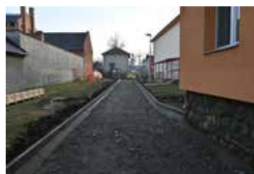
I přes zimní měsíce pokračuje výstavba v obci strana 3