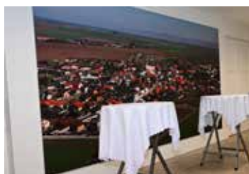
Představuje se zrekonstruovaný Kulturní dům strana 7 - 10