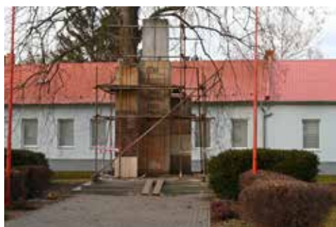
Před obecním úřadem pokračují i rekonstrukční práce na pomníku prvního a druhého odboje.