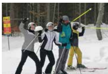
Žáci základní školy si užili sněh alespoň na horách strana 5