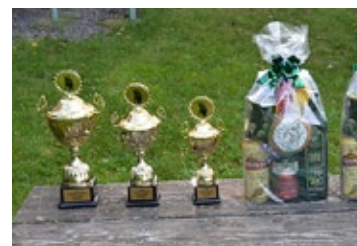
Střeleckou soutěž narušil vítr, ale myslivci to nevzdali