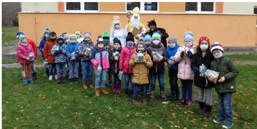
S první třídou