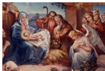
Termíny svátečních bohoslužeb v kostele