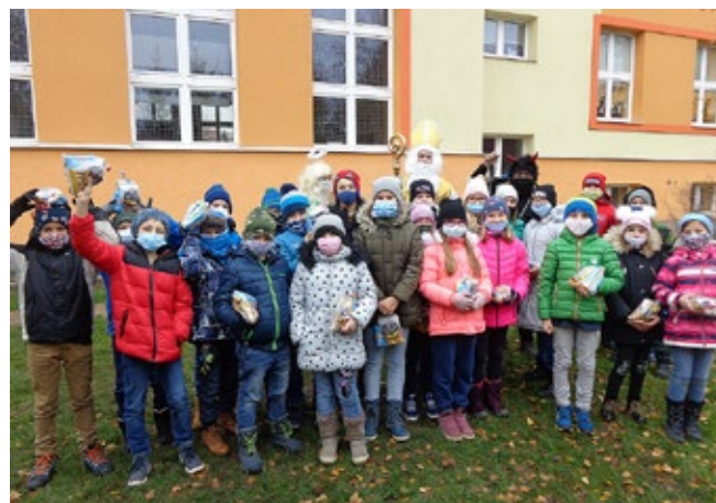
Se čtvrtou třídou