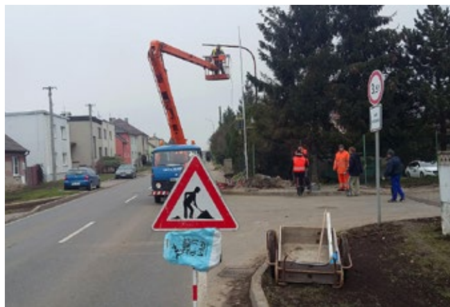
Další pohled na stavbu veřejného osvětlení v Lutínské ulici