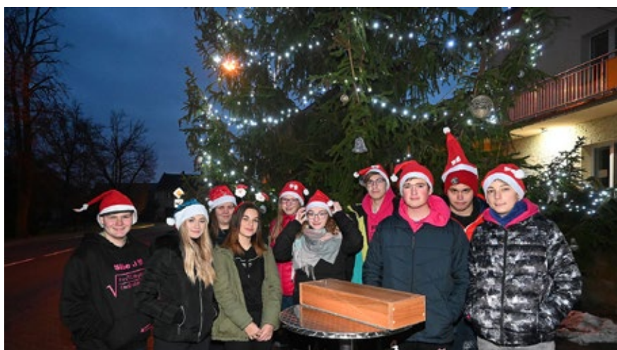
Slavnostní rozsvěcování se letos nekonalo, strom rozsvítili alespoň symbolicky žáci deváté třídy