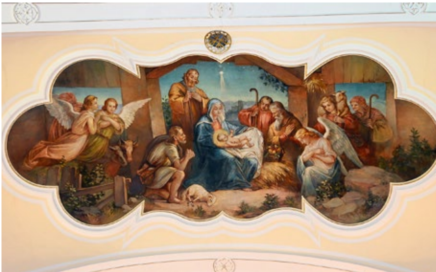
Narození Ježíška v Betlémě na fresce v kostele svatého Leonarda v Hněvotíně