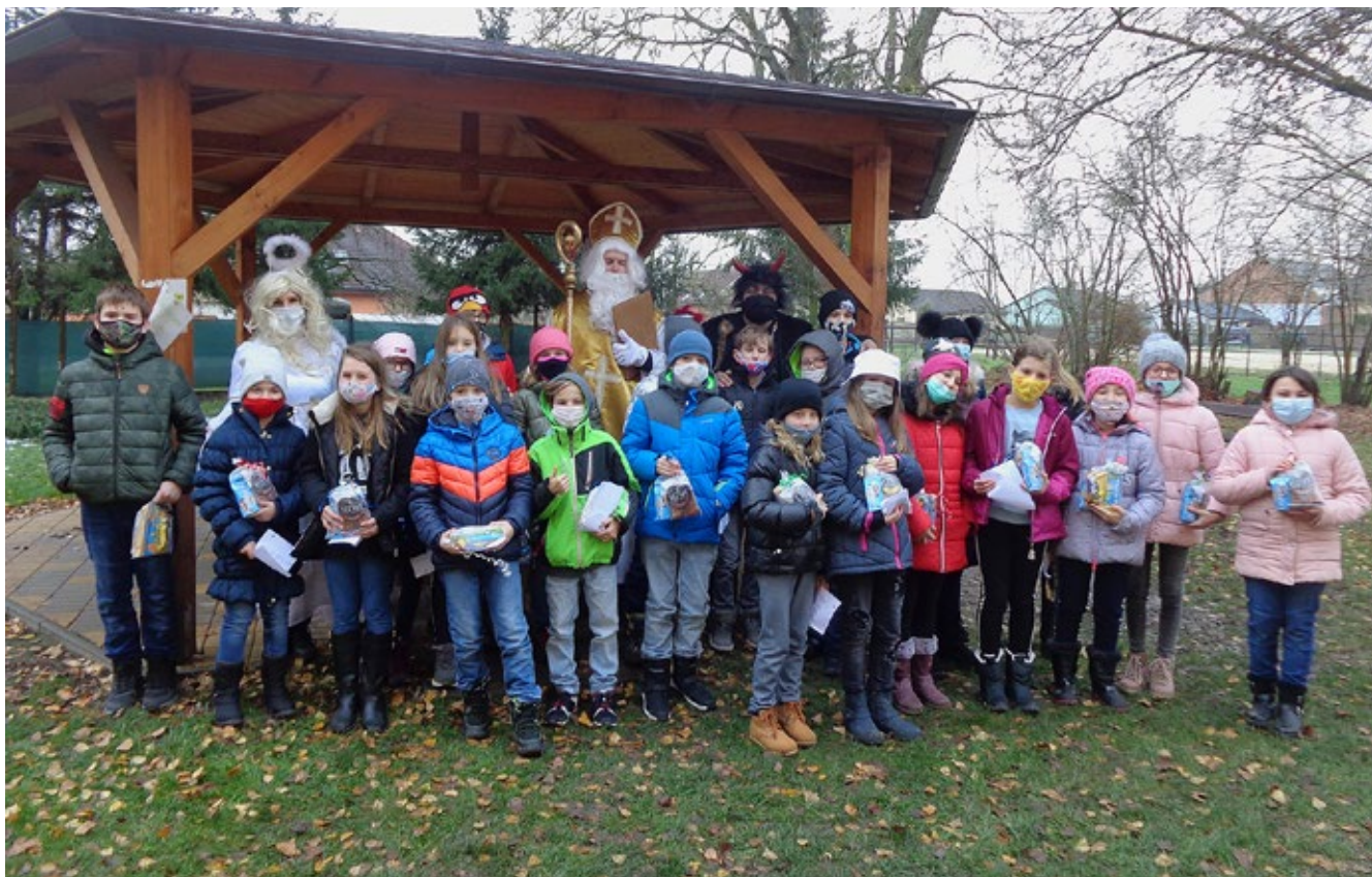
Na školáky si letos Mikuláš s čertem a andělem výjimečně počíhali venku. S páťáky se nakonec vyfotili před altánkem.