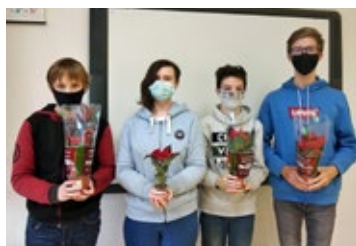
Hněvotínští žáci se zapojili do sbírky Vánoční hvězda