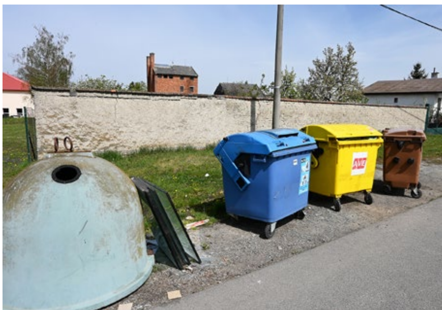
Velkoobjemový odpad nepatří ke kontejnerům, ale do sběrného dvora v areálu firmy Müller