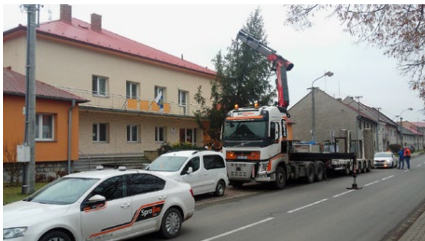
Zaměstnanci obecního úřadu společně s firmou Spro strom skáceli, převezli, vztyčili a nazdobili