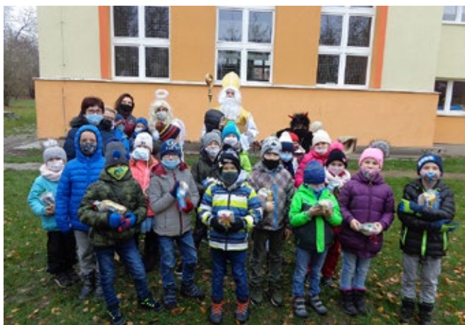
S druhou třídou