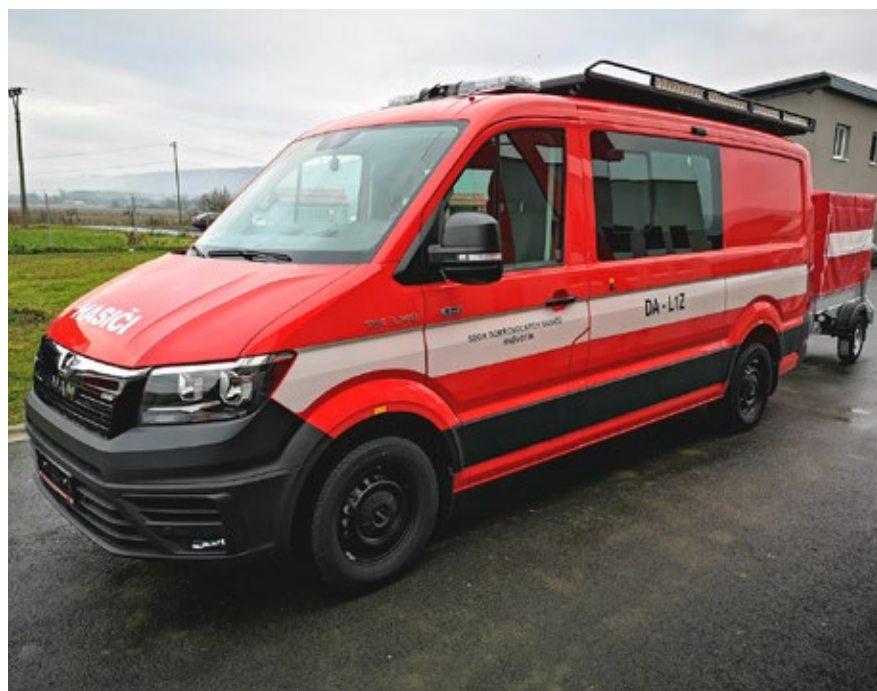
Díky příspěvku z Ministerstva vnitra ČR, Olomouckého kraje a obce Hněvotín mají dobrovolní hasiči nový automobil s přívěsem