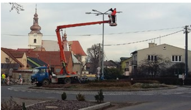
Oprava veřejného osvětlení na kruhové křižovatce u obchodu