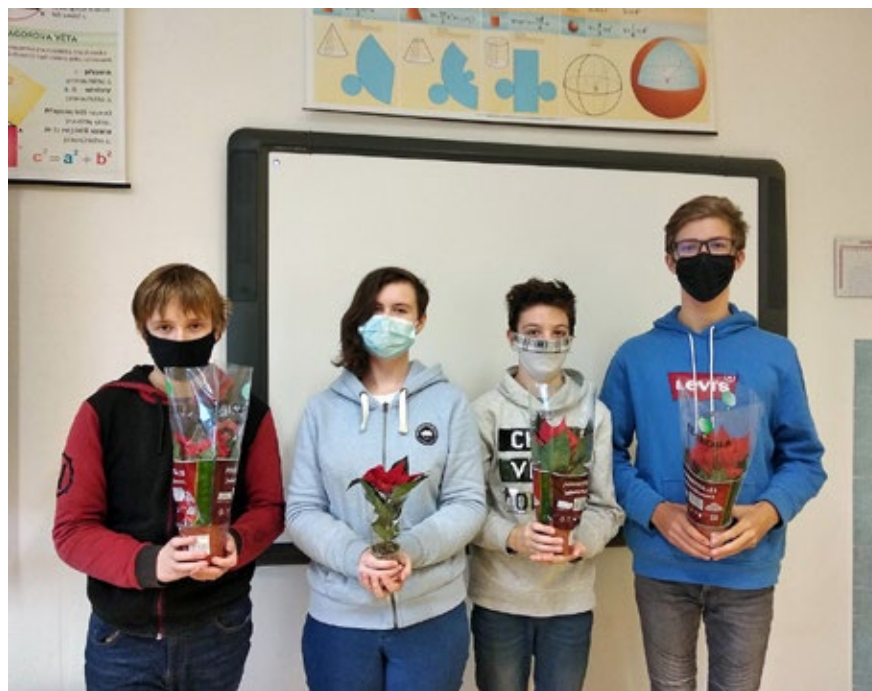
Nejvíce hvězd si zakoupili žáci 8. třídy