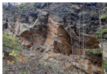
Od nalezení jeskyně ve Skalách uplynulo 95 let