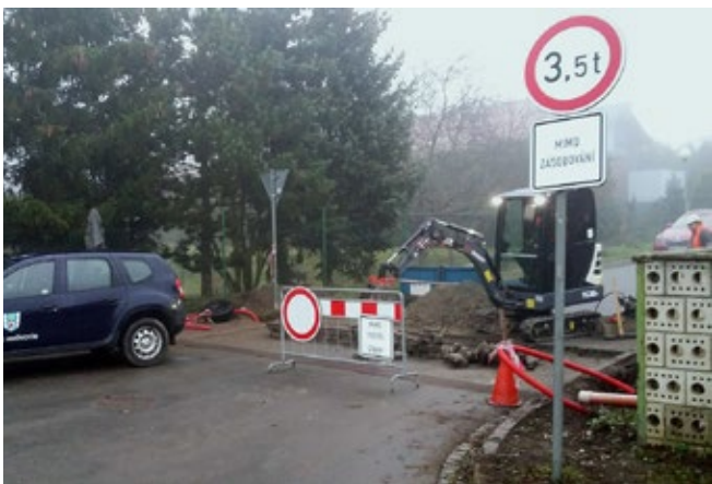
Obec staví nové veřejné osvětlení v Lutínské ulici svépomocí