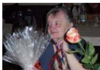
Podzimní setkání seniorů obce strana 7