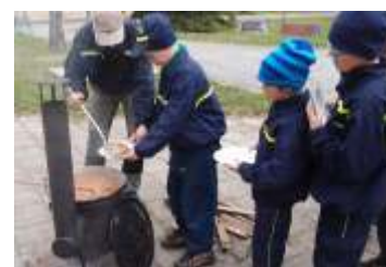
Branný den mladých hasičů strana 10