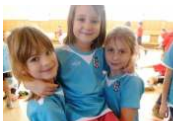
Žáci základní školy získali Starostuv vdolek strana 4