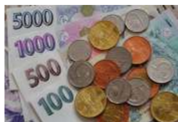
Rozpočet obce na rok 2017 byl schválen strana 2