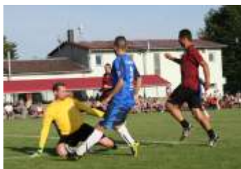
Pustíme se do náročné rekonstrukce sportovního areálu? strana 8