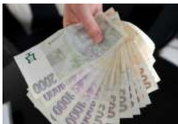
Projednávají se rozpočty obce a ZŠ a MŠ na rok 2017 strana 3