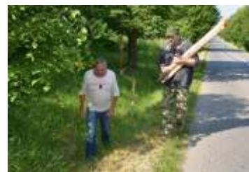
Z činnosti Mysliveckého spolku Blata Hněvotín strana 14