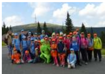
Vracíme se k letnímu táboru hněvotínských dětí strana 12 - 13