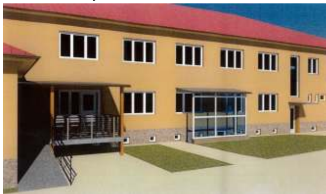
Strategický plán obce hovoří i o rekonstrukci Kulturního domu. Na obrázku můžete vidět jeden z návrhů budoucí možné podoby.

Hlavním bodem zasedání bylo projednání a schválení 2. aktualizace strategického plánu obce s výhledem do roku 2016, ve kterém byly stanoveny návrhy řešení problémů obce a její rozvoj pro nejbližší roky. Dokument je k dispozici na Obecním úřadě v Hněvotíně a také na obecních webových stránkách.