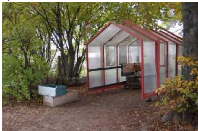
Přístřešek pro sběrový papír se nachází za budovou školy.

Naše škola se přihlásila do soutěže společnosti van Ganswinkel, jejímž nosným mottem je „Nic není odpad“. Za každý kilogram odevzdaného papíru získáme 2,27 Kč. Finanční bonus 20 000 Kč získá škola, která v celkovém součtu za období od 1. září 2011 do 15. června 2012 dodá největší množství papíru v průměru na 1 žáka, druhá škola v pořadí získá 12 000 Kč.