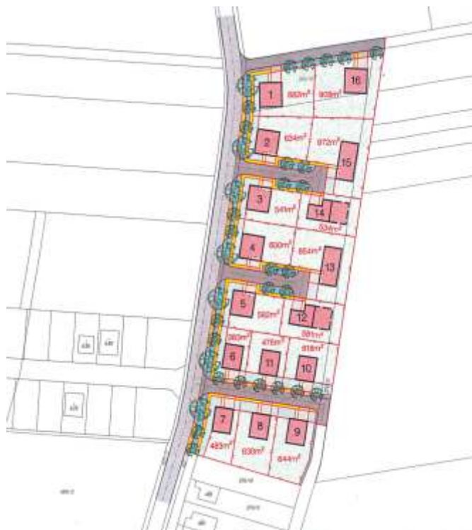
Územní studie řešící nově vzniklou lokalitu na Topolanské ulici počítá s výstavbou až šestnácti rodinných domů.

Byly projednány smlouvy s firmou ČEZ o věcných břemenech a kupní smlouva na již zmiňovaný prodej