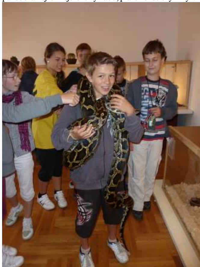
Někteří odvážlivci si dokonce nechali dát za krk asi dva metry dlouhého hada – krajtů tmavou.

V úterý 4. října 2011 si 6. a 7. třída vyrazila do Vlastivědného muzea v Olomouci, kde se konala zajímavá výstava terarijních zvířat. K vidění tam byli křečci, želvy, pavouci a nejrůznější druhy hadů, plazů i exotický hmyz.