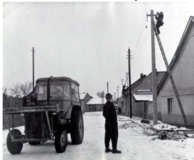
Rozvody elektrické energie na železných konzolách vydržely bezmála 50 let. Na snímku z roku 1962 je právě pracovník Elektrických rozvodných závodů přemísťující tehdejší dřevěný stožár.

Největší změnou je přemístění všech venkovních rozvodů elektrické energie do země. Ke každému domu je přivedena nová elektrická přípojka a instalován venkovní rozvaděč. Na domech dochází k demontáži železných konzol elektrického vedení. Prováděcí firmy musí odstranit konzoly zdarma opravit průstupy do stěn a fasád domů. V této souvislosti byla i obec nucena vyšetřit přemístění veřejného osvětlení ze stávajících nosníků na budovách. Museli jsme uvolnit peníze na nové osvětlení (nové samostatné stožáry a celé rozvody elektrického vedení), které by měly být hotové do konce měsíce května. Plánovanou rekonstrukci komunikací jsme však nuceni