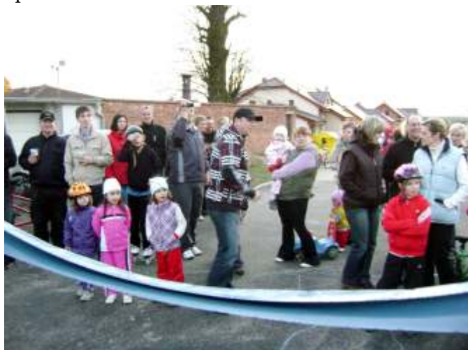
Při uvádění nově opravené cesty do provozu došlo i na symbolické přestřižení pásky a jmenování patrona cesty.

Od roku 2001 vyrostlo v lokalitě „Za Školou“ přibližně 30 domů, nastěhovalo se 27 nových rodin a přibýlo 91 nových občanů. Všichni tito občané s nadšením sledovali uspokojivý rozvoj obce, nové cesty a chodníky, krásně opravenou školu a školku, prvotřídní hřiště a množství kulturních i sportovních akcí, na kterých mají občané možnost se potkávat a navazovat nová přátelství nebo upevňovat ta stará.