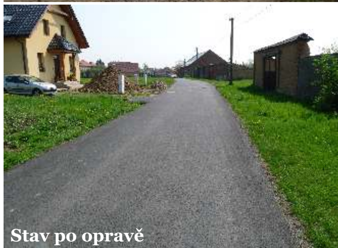
Stav po opravě

Letos 1. dubna 2011 jsme se však vytoužené opravy zmíněné cesty dočkali a naši lokalitu s okolním světem spojuje krásná asfaltová cesta, která se určitě brzy stane i vyhledávaným lákadlem pro bruslaře, cyklisty a jiné nadšence. My všichni z naší lokality „Za Školou“ jsme se ten den sešli a opravu cesty náležitě oslavili.