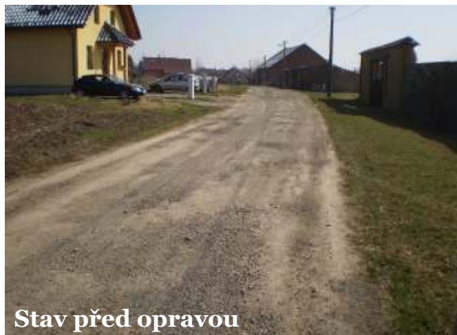
Stav před opravou