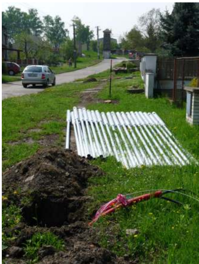
Snímek zachycuje stav prací na veřejném osvětlení v části obce Malý Váلكov.