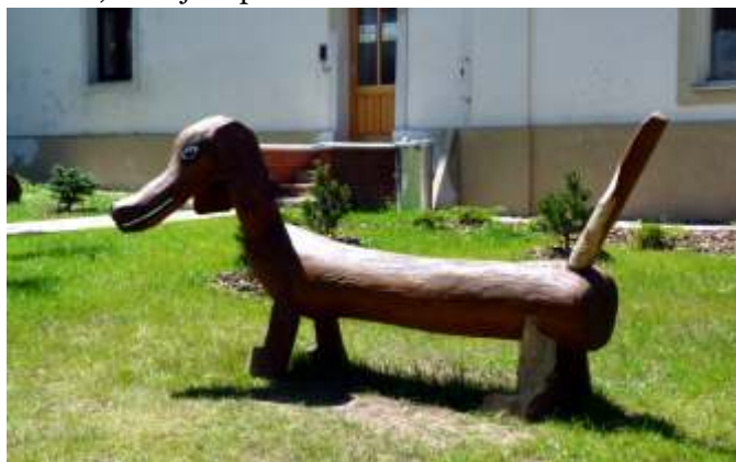
Dřevěná plastika jezevčička z dílny pana Naše byla v nedávné době umístěna před vchod do mateřského centra Beruška.

Nejraději mám abstrakci, vyjadřující nějaký pohyb - vlnění, proudění, tryskání. V poslední době jsem dělal plastiky andělů. Pouze u dřevěných prvků na dětská hřiště volím konkrétní podoby, aby děti poznaly, jaké zvíře plastika představuje. Tak například často vytvářím jezevčiky sloužící jako lavička, nebo plastiky dutých hrochů, které jsou prolézačkami.