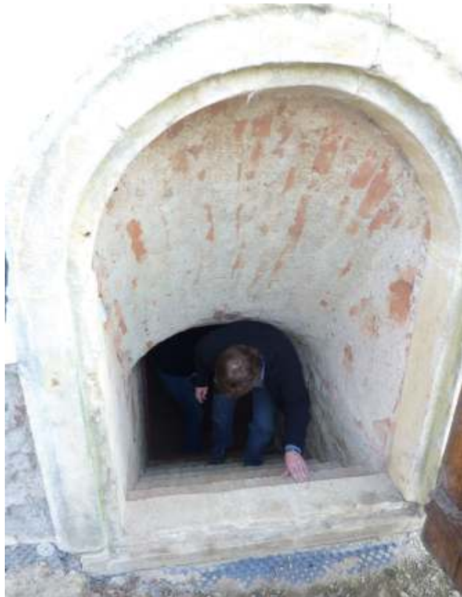
Noc kostelů 2010: kdo chce navštívit prostor krypty kostela, musí absolvovat krkolomný sestup.

V pátek 28. května 2010 proběhla v našem kostele stejně jako v mnoha jiných kostelích v České republice akce Noc otevřených kostelů, a to podle programu, který byl