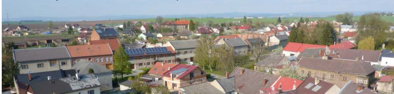
Noc kostelů 2010: pohled na obec z věže kostela se nenabízí každý den.