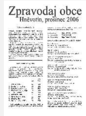
Prosinec 2006, rychlé vydání po obecních volbách.