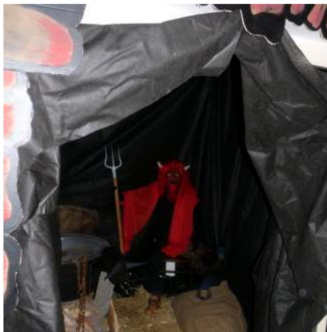
Celý program akce byl bedlivě sledován vyslanými zástupci pekelné moci.