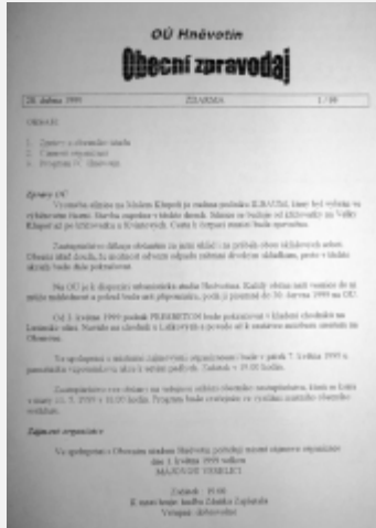
Duben 1999, první vydání Obecního zpravodaje.