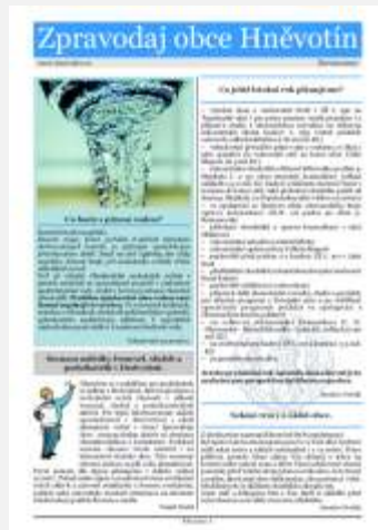
Červen 2007, první barevné vydání.