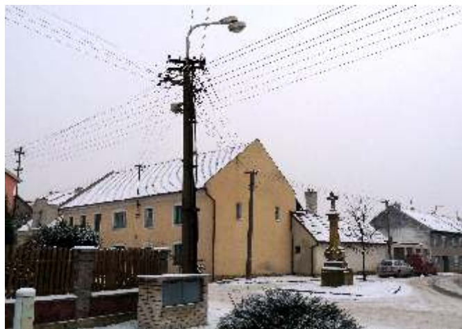
Bude za rok tento pohled minulostí a dočkají se obyvatelé obou Válkovů uložení rozvodů elektrické energie do země?

Tato společnost bude v naší obci investovat v příštím roce cca 8 miliónů korun v souvislosti s novým rozvodem vysokého napětí a vybudováním tří nových trafostanic v lokalitách Kout, Za školou a Za hřištěm. Tyto transformátory budou propojeny podzemním vysokonapěťovým kabelem. Dále bude zasíťována nízkonapěťovým rozvodem lokalita Za hřištěm. Budeme tedy zase kopat.