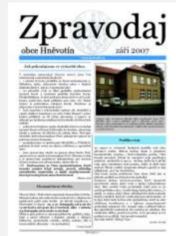
Září 2007, úprava titulní stránky.