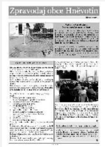
Březen 2007, nová podoba Zpravodaje.