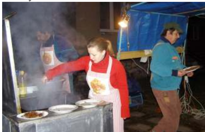
Na Rozsvícení vánočního stromku obce se loni bramboráky smažily z 50 kg brambor, letos z 80 kg.

Poděkování patří i pedagogům základní školy a dětem za kulturní program a zapojení do příprav. Děkuji zaměstnancům obce a vám všem, kteří jste přispěli k této hezké a již tradiční akci.