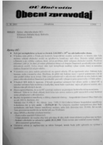
Říjen 2003, úprava titulní strany.