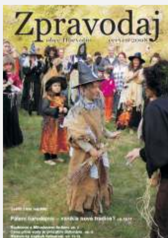
Červen 2008, první titulní stránka s fotem.