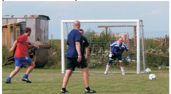
K vidění byly dramatické situace v kopané ...

Bez ohledu na sportovní dovednost všichni bez výjimky bojovali s velkým zápalem a nasazením, mnohdy za vydatného povzbuzování přihlízejících. Na své si přišli i ti nejmenší, pro které naši hasiči přichystali pěnovou lázeň. Pro zúčastněné bylo připraveno občerstvení z udírny, vpoledvečer program zpestřilo vystoupení countryové kapely. Celý program provázelo příjemné počasí, které umožnilo uskutečnit atraktivní propagační seskok parašutistů z Hanáckého paraklubu.