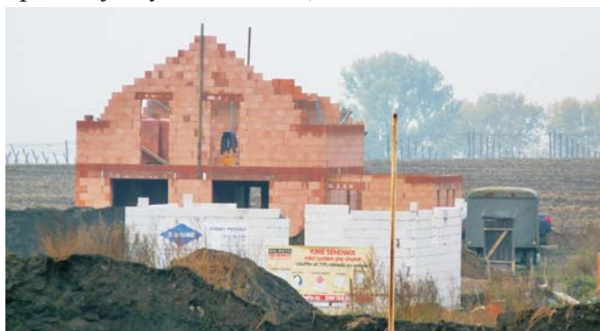
V lokalitě Za hřištěm se pomalu objevují první hrubé stavby.