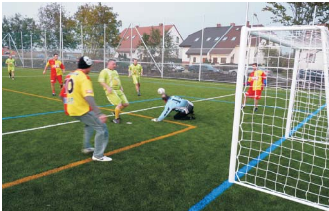
Nové hřiště už je svědkem tuhých bojů v malé kopané.

V plánované rekonstrukci a modernizaci sportovního areálu FC Hněvotín byl udělán první významný krok. V části areálu ležící podél Topolanské ulice na výjezdu z obce bylo vybudováno hřiště s umělým povrchem.