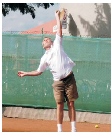
... vzorové servisy v tenise ...