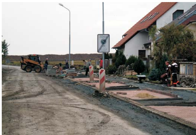
Finišují práce na položení chodníků a zbudování vjezdů. V době vydání tohoto čísla Zpravodaje by mělo již probíhat položení živичného povrchu.

Byli jsme nuceni provést přeložky napojení sousedních ulic, rozšířit ve dvou ulicích dešťovou kanalizaci, prodloužit vodovod a vybudovat dalších 12 uličních vpustí na odvádění dešťových vod. V těchto dnech již probíhá položení závěrečných živичných vrstev komunikace a všichni si oddecháme. Hluku, prachu, bláta i otřesů si občané v ulici Topolanské užili dost.