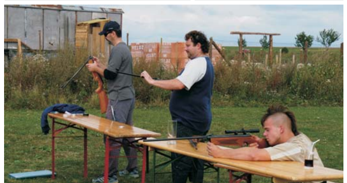
... i soustředění střelců.