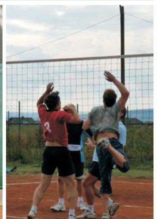
... baletní vložky ve volejbale...