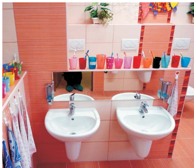
Sociální zařízení jsou chloubou. Jejich, chtělo by se říci až výtvarné řešení, je dílem pracovnic školky.

Ke každé třídě patří samostatná umývárna a šatna. Třída je rozdělena na část, v níž děti svačí, obědvají a mají možnost si hrát u stolečků. V herně si děti hrají, cvičí a odpoledne odpočívají. Třídy jsou vybaveny novým nábytkem, židličkami, stoly, lehátky, kobercem, dekoracemi. Sklady slouží k uložení učebních pomůcek a pomůcek pro výtvarnou a tělovýchovnou činnost. Dětem byly zakoupeny nové hračky, stavebnice, kuchyňky, kočárky, panenky, didaktická technika aj. Hrací koutky umožňují rozvoj herních aktivit. Celkové vnitřní uspořádání všech prostor vyhovuje současným hygienickým normám a požadavkům.