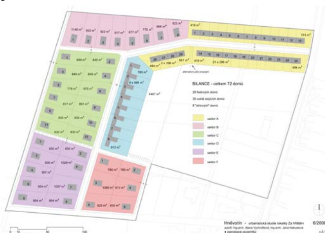
Opět lokalita Za hřištěm. Takto vypadá urbanistická studie pro 72 domů, které zde mají vyrůst.

Jak jsme vás již průběžně informovali, zastupitelé se postupně dopracovali k podobě 3. změny Územního plánu.