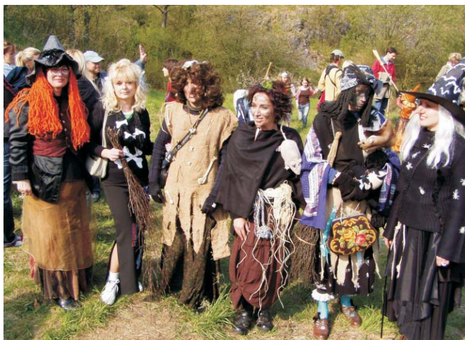
Ozdobou reje byly tyto čarodějnice a i když se usmívají víme, že občas umějí pěkně zatopit.

Program byl zahájen zapálením 2,5 metrové hranice, které vzplála v 15.30 hod. Poté již následoval pestrý program řízený diskžokejem, který kromě taneční muziky nabídl i možnost zúčastnit se na několika stanovištích různých soutěží. Pro všechny bylo v areálu skal připraveno i bohaté občerstvení nejen z udírny.