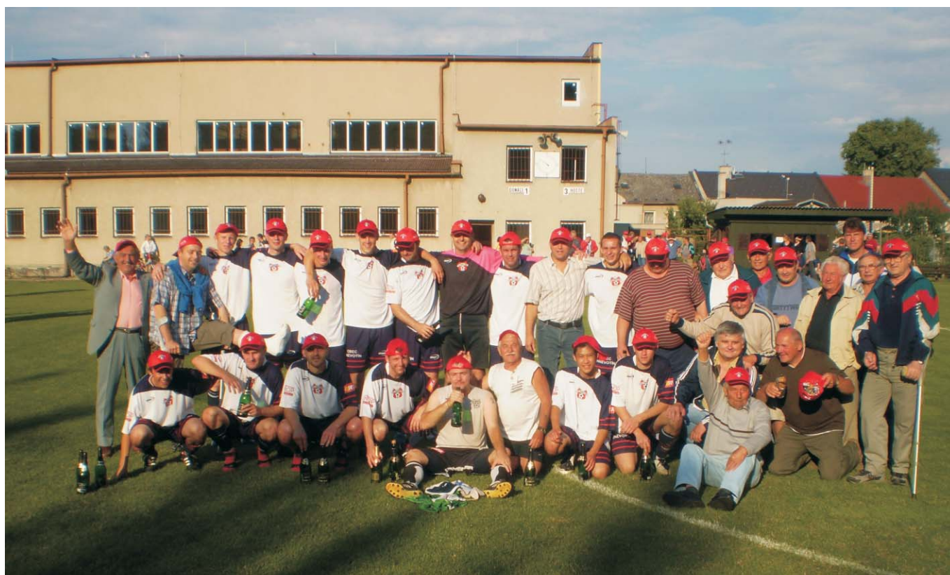
Na společném snímku nemohlo samozřejmě chybět „tvrdé jádro“ hněvotínských fanoušků. Ti své chlapce po celou sezónu neúnavně povzbuzovali.