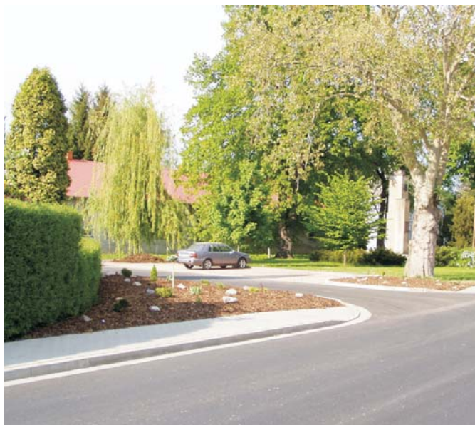
Tvář obce pomalu dozrává změn. Dokladem jsou i velmi podařené úpravy před obecním úřadem.

Schválení 2. změny územního plánu obci umožňuje :