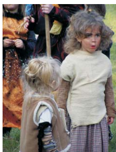
Stejně jako u hasičů i zde je o následnice zřejmě postaráno.

V 17.00 hod. pak nastal velký rej čarodějnic a čarodějů, všemožně se snažících zaujmout porotu, sestavenou za účelem vyhodnocení nejlepších masek. Hodnocení to bylo velmi náročné. Účastníci reje prokázali ve všech věkových kategoriích opravdu velkou fantazii a tak bylo možné na maskách mimo jiné spatřit i velké množství různé havěti, pavouky počínaje a různými hlodavci konče. Vrcholem čarodějnické elegance však u některých jedinců bylo nazdobení se kosterními pozůstatky blíže nerozpoznatelnými zástupci naší fauny. Porota se ale svého úkolu zhostila na výbornou a ceny pro vítěze všech kategorií skončily ve správných pařátech.