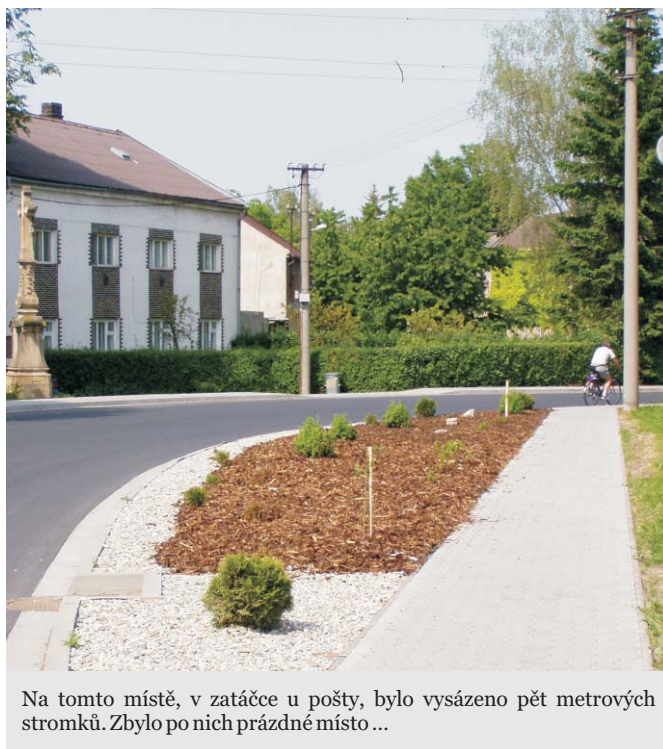
Na tomto místě, v zatáčce u pošty, bylo vysázeno pět metrových stromků. Zbylo po nich prázdné místo ...