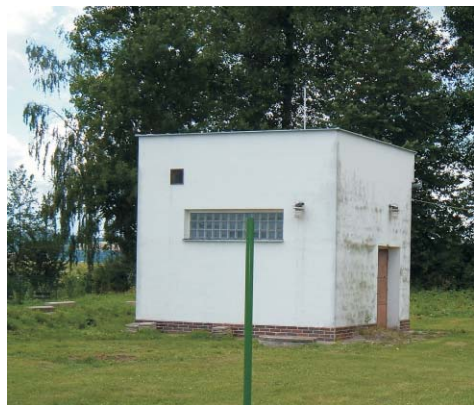
Obec v současné době disponuje třemi zdroji pitné vody. Jedním z nich je vodárna vedle fotbalového hřiště.

Zalévání trávníků, možná i zeleniny, provoz bazénů bude stát při používání obecního vodovodu stále více finančních prostředků.