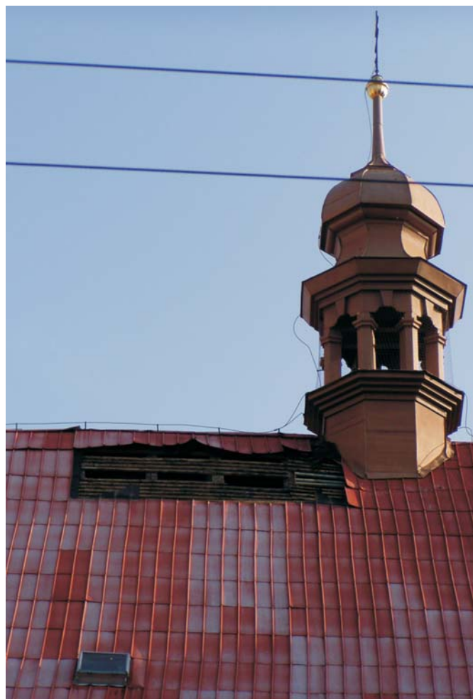
Ve středu 25. června zasáhly celou republiku přivalové deště a bouřky, které se nevyhnuly ani Hněvotínu. Kostel tak přišel o malou část své střechy.